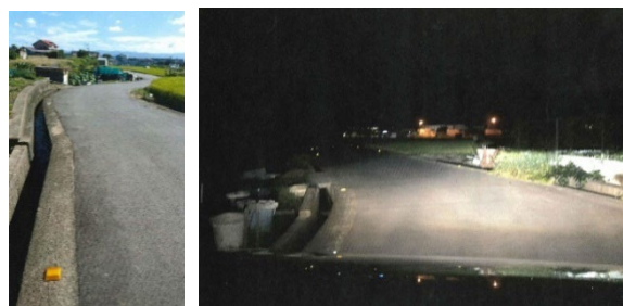
◀ 夜間車内から撮影

行政相談委員が現地確認し、市役所に連絡をしたところ、地元の自治会から市に要望することが有効であることが分かりました。地元の自治会に依頼して要望してもらったところ、道路に沿って反射板が設置されました。こども園の保護者からは、夜間でも安心して運転できるようになったと好評です。